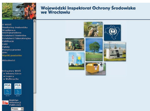
Rysunek 12.2. Strona internetowa WIOŚ we Wrocławiu ( www.wroclaw.pios.gov.pl )

W trybie Ustawy o dostępie do informacji publicznej wpłynęło do WIOŚ 28 wystąpień o udzielenie informacji lub udostępnienie dokumentów i danych – wszystkie wnioski zostały załatwione pozytywnie. Ponadto w odpowiedzi na wnioski osób fizycznych i prawnych złożone ustnie, na piśmie lub drogą elektroniczną udzielono w 2009 r. 199 informacji na temat poziomu zanieczyszczenia powietrza, przygotowanych na podstawie danych pochodzących z systemu Państwowego Monitoringu Środowiska.